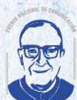
CARDENAL JUAN LANDÁZURI RICKETTS