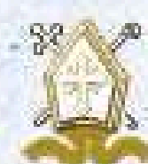
Conferencia Episcopal Peruana